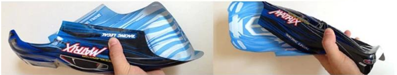
PVC material car shell