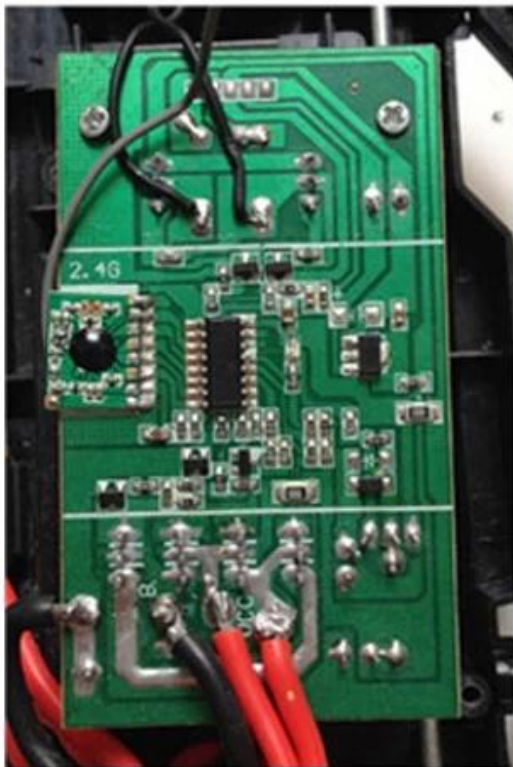
2.4Ghz Remote Control