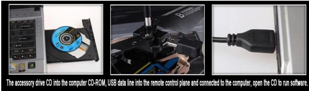
The accessory drive CD into the computer CD-ROM, USB data line into the remote control plane and connected to the computer, open the CD to run software.