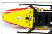
THE BOTTOM OF THE PLANE