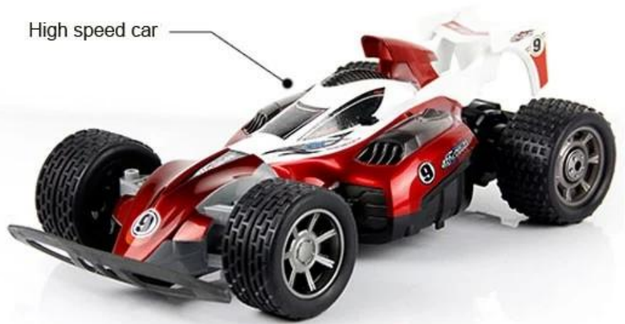
High speed car