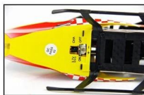
THE BOTTOM OF THE PLANE