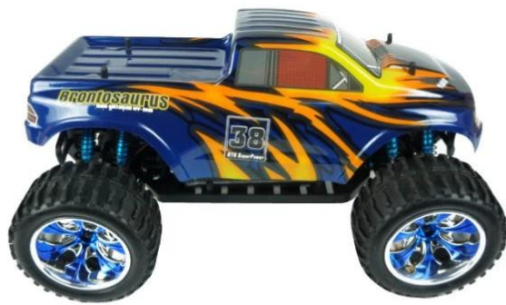
Right side view