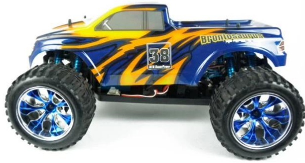
Left side view