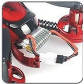
3.7V 380mAh LI-PO