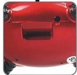
2 GB MEMORY CARD