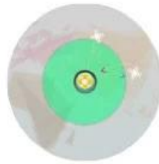
Fail - Safe