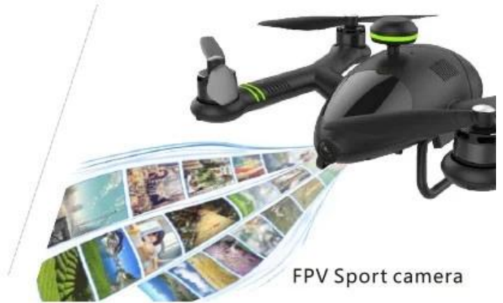
FPV Sport camera