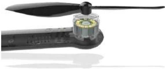
Well-Functioning heat dissipation system