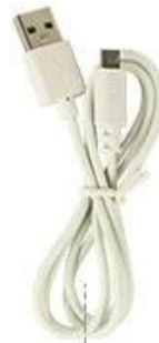
USB DATA CABLE