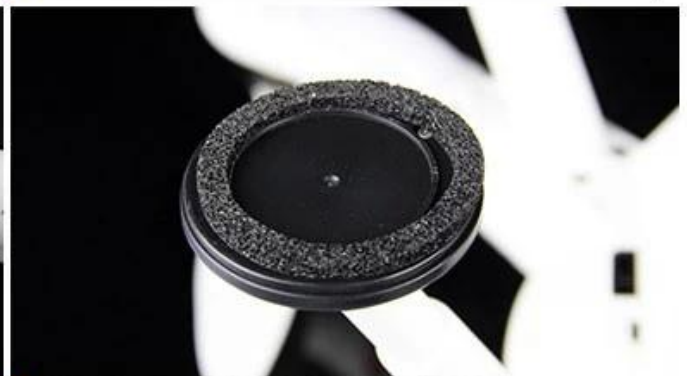
SKID LANDING GEAR