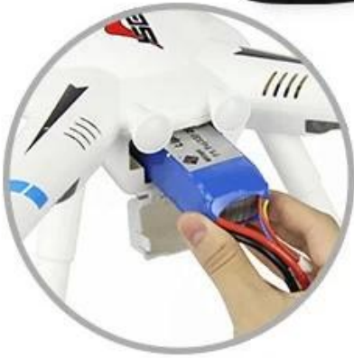
SUPER CAPACITY BATTERY