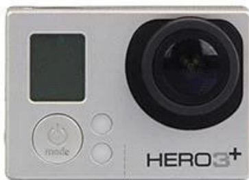
CAMERA ( IN ADDITION TO BUY )